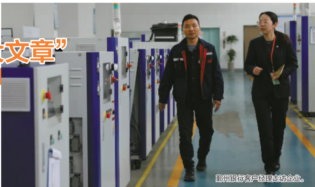
鄞州银行客户经理走访企业。