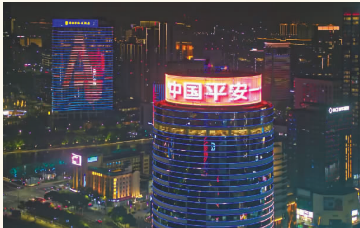
平安人寿宁波分公司灯光秀。

目前,平安居家养老已进入深化布局阶段,截至2024年11月,宁波地区已有2500余位客户达到平安居家养老服务的标准。