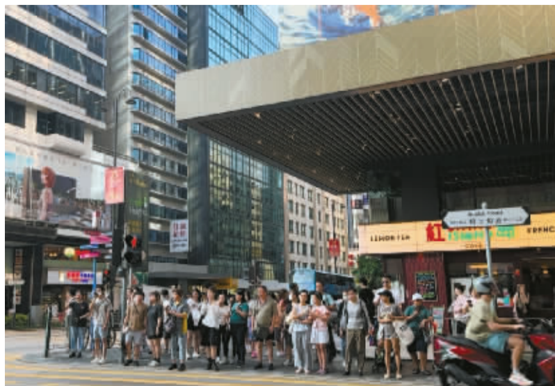
香港柯士甸道街头一景。