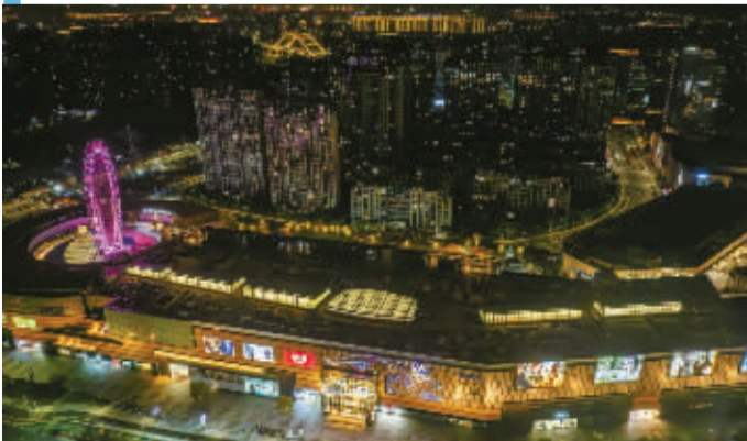
有人进入梦乡，有人还在路上。晚上8点七分，