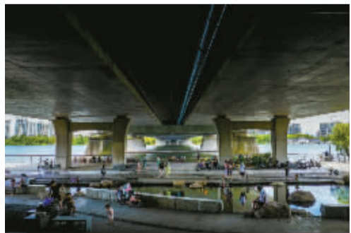
盛夏临近中午时，老老小小都喜欢到桥下纳凉。