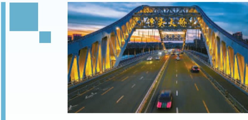
晚高峰后车流回落，华灯初上。黄昏7点多，