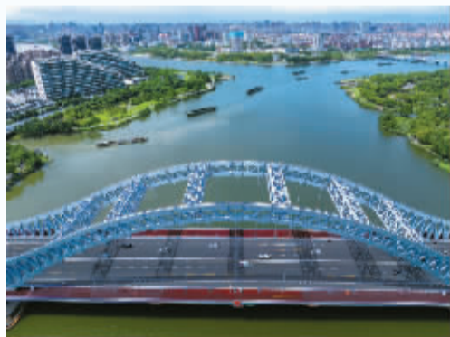
上午10点多，江上船来船往。