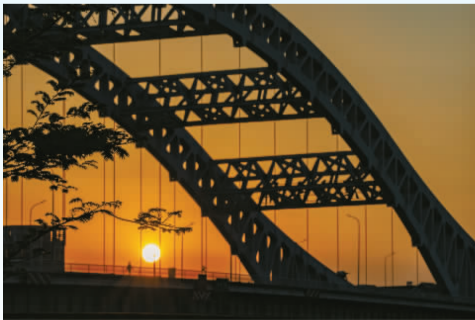
傍晚6点，归家的人在落日余晖里徜徉。