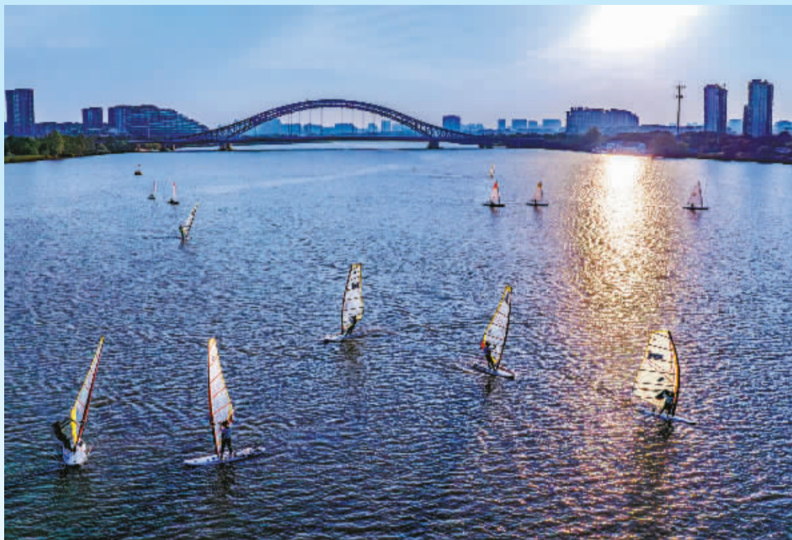
下午4点，江上的人乘风破浪。

也是一群人的岁岁年年。在她的镜头下，一座桥的朝朝夕夕，摄影师钱霞琼长期拍摄这座改变了很多人生活的桥，附近的一切也悄然改变。5年前，湾头大桥通车，前身是宁波市蔬菜种植基地，江北湾头片区，