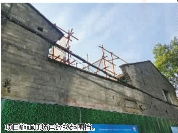
项目施工现场已经拉起围挡。