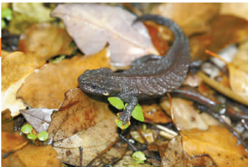
“宁波大熊猫”镇海棘螈。