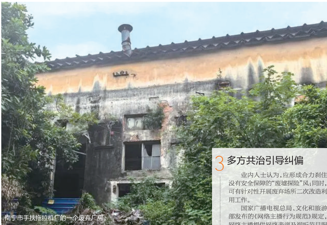
南宁市手扶拖拉机厂的一个废弃厂房。

广西社会科学院社会学研究所所长姚华说，这些废弃场所景色比较特殊，往往有荒凉感、工业感，拍出来的视频、照片风格鲜明，有的甚至成为“流量密码”。