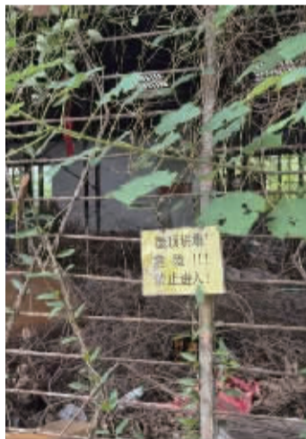
南宁手扶拖拉机厂的一些厂外外侧，设有警示牌。

值得注意的是，为了博眼球，不少类似视频刻意制造迷信、恐怖气氛。“神秘仪式”“鬼魂”……在一些视频里，博主为了增强恐怖气氛，不时在解说中“添油加醋”，以博取更多流量。这些渲染