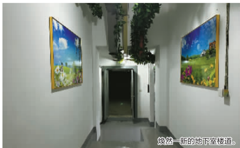
焕然一新的地下室楼道。