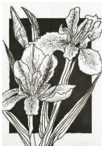
鄞州区钟公庙实验小学402班 童夏仪(证号2461176) 指导老师 蒋家璐