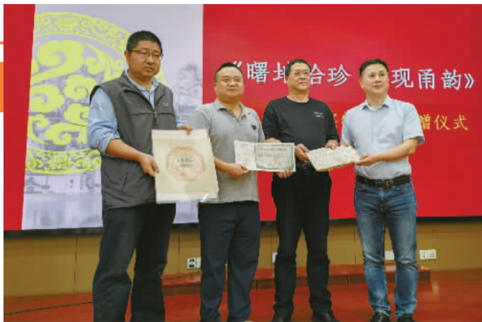
新书首发式上的捐赠环节。