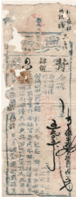
宁波紫薇街兴源典当票