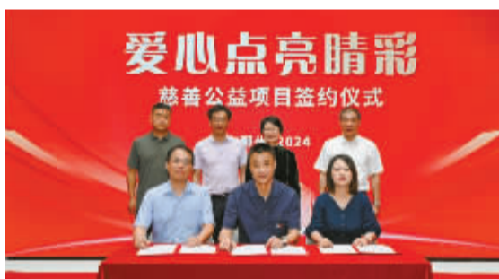
「爱心点亮睛彩」慈善公益项目启动仪式现场。