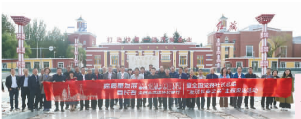
一汽“一号门”作为新中国汽车工业的发源地,承载着一汽的起点,也是整个中国汽车工业的起点。

9月21日,“高质量发展看长春”全国主流媒体长春行暨全国党报社长总编“发现长春之美”主题采访活动启幕,两天的时间里,来自中国晚报工作者协会近百家新闻单位的媒体人先后走进中国一汽、长光卫星等地,多角度地记述长春全面振兴率先实现新突破,实现可持续振兴的高质量发展故事。新闻工作者以脚力深耕脚下黑土,以眼力发现万千气象,以脑力编织长春图景,以笔力传播长春声音,在长春大地上书写出生动的“四力”答卷,为长春的高质量发展注入了强大的媒体力量与舆论支持。