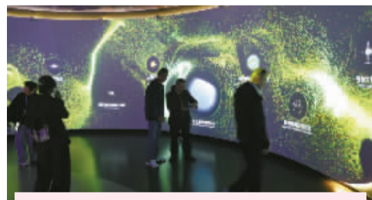
在时空旅程(长春)人工智能科技研学体验馆,采访团体验了一场穿越时空的奇妙之旅。