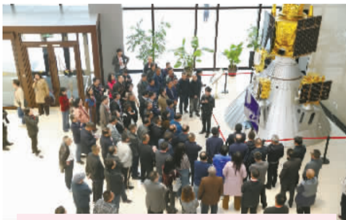
9月21日,采访团在长光卫星技术股份有限公司采访。长光卫星是我国第一家集卫星研发制造、运营管理和遥感信息服务于一体的全产业链商业遥感卫星公司。

9月21日,“高质量发展看长春”全国主流媒体长春行暨全国党报社长总编“发现长春之美”主题采访活动启幕,两天的时间里,来自中国晚报工作者协会近百家新闻单位的媒体人先后走进中国一汽、长光卫星等地,多角度地记述长春全面振兴率先实现新突破,实现可持续振兴的高质量发展故事。新闻工作者以脚力深耕脚下黑土,以眼力发现万千气象,以脑力编织长春图景,以笔力传播长春声音,在长春大地上书写出生动的“四力”答卷,为长春的高质量发展注入了强大的媒体力量与舆论支持。