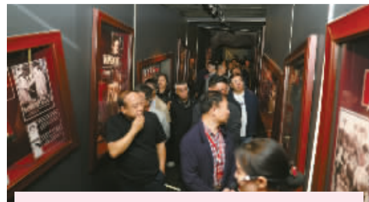
采访团来到承载着新中国电影辉煌历史的长春电影制片厂旧址博物馆,感受电影产业在新时代背景下的高质量发展。