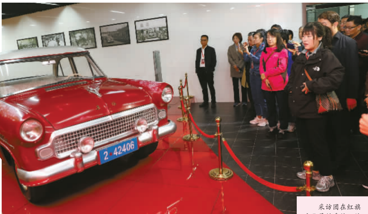
采访团在红旗文化展馆采访。该展馆陈列了20辆新老红旗轿车和大量的历史文献资料,展示了红旗品牌50多年来的发展历程。