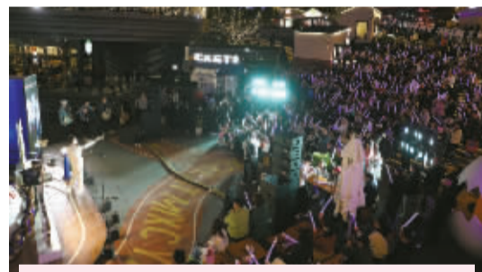
9月21日晚,2024长春文旅街头音乐会的收官演出在长春万象城广场举行,歌声唱出了长春人的浪漫,也唱出了属于长春的文化韵味。