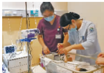
医护团队对宝宝实施个性化精准护理。