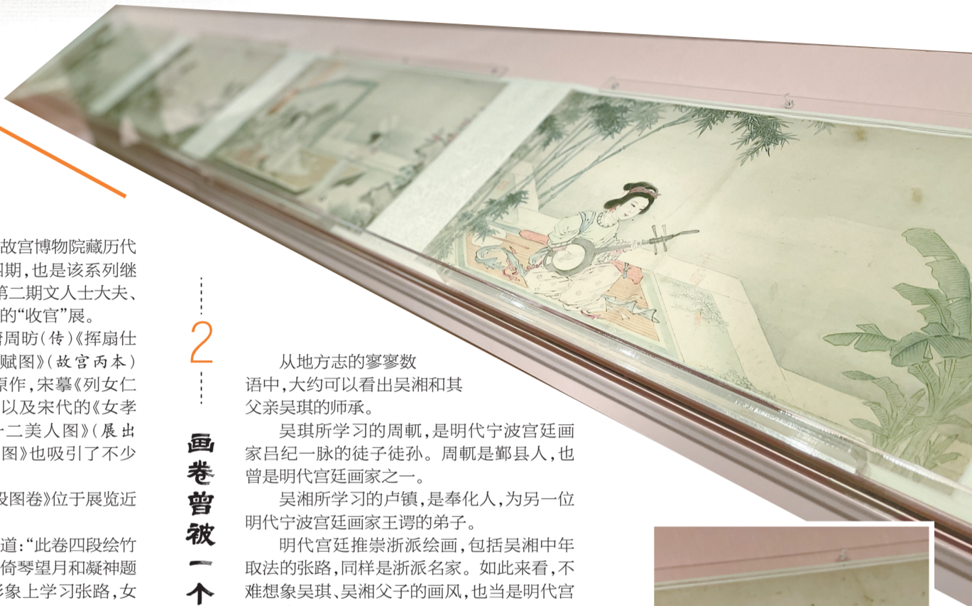
吴湘《仕女四段图卷》展出现场。