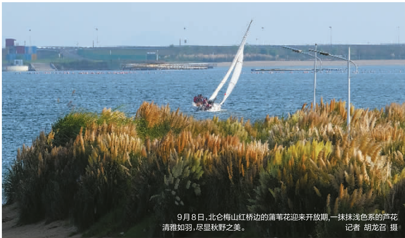
9月8日,北仑梅山红桥边的芦苇花迎来开放期,一抹抹浅色系的芦花清雅如羽,尽显秋野之美。

9月7日,白露至,就像是吹响了从夏天“奔”向秋天的号角。新的一周(9月9日-9月15日),我们将迎“秋”来。