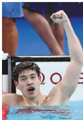
潘展乐在比赛后庆祝夺冠。