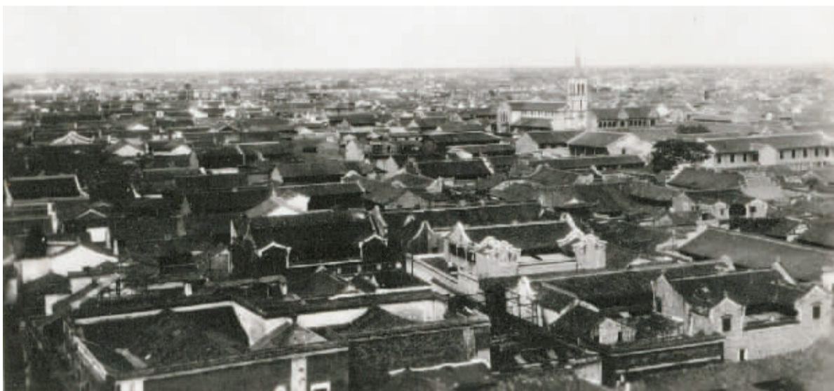
1932年左右的宁波城旧影。