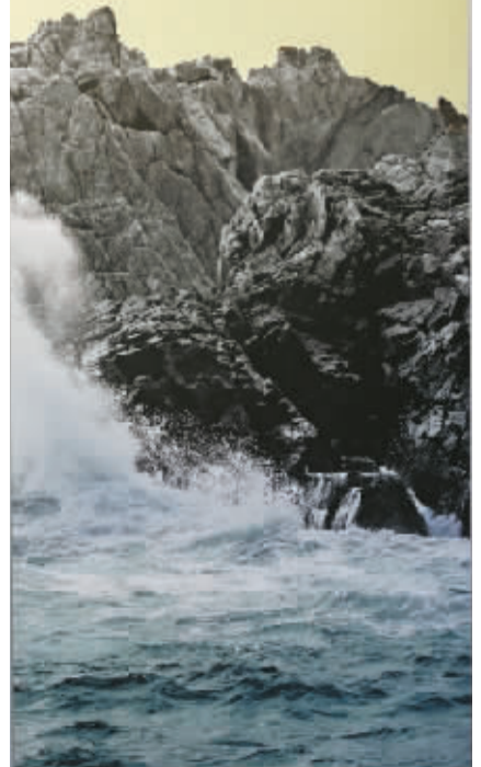
紫荆汇里高挂的壁画，是香港著名的大屿山晨景。