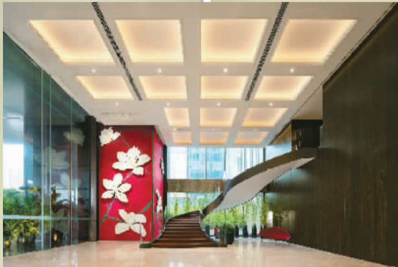
紫荆汇一楼大堂的紫荆花墙。

立到装修设计，还有艺术品的收藏、文化意义的汇集、食品的设计……她事无巨细，花尽心思。