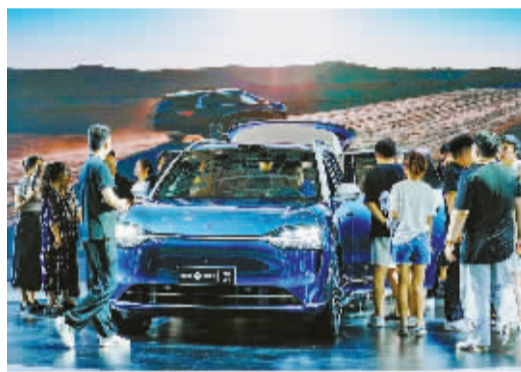
市民在汽车销售门店咨询体验。

前不久，《宁波市推动大规模设备更新和消费品以旧换新实施方案》(以下简称《方案》)正式发布。多项政策刺激之下，激活宁波消费市场“一池春水”。