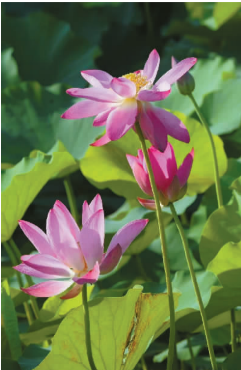
盛夏的清晨,日湖公园的荷塘有着一番别样的清凉与生机。

面对炎炎夏日,与其心浮气躁,不如“更宜调息净心,常如冰雪在心,炎热亦于吾心少减”。