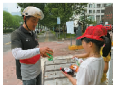
给户外工作者送清凉。