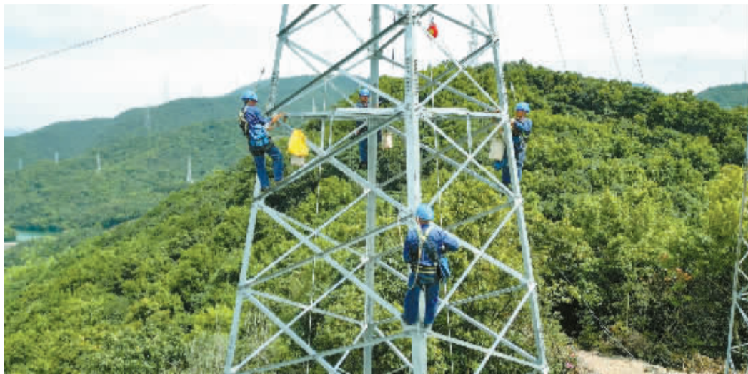
电力人在铁塔上检修。