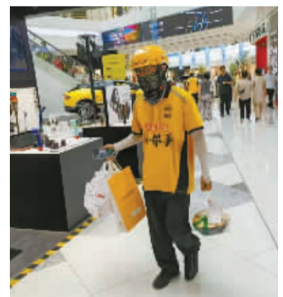
一名“全副武装”的外卖小哥手里拎满了要配送的餐食。

鄞州区一家美团外卖网点站长朱先生告诉记者,为了让小哥们在高温天能顺利完成送单,平台不仅提供一些高温补贴的激励,也会准备好藿香正气水、花露水、十滴水等防暑药物,以备不时之需,并提醒小哥们做好防晒降温措施,“如果送餐有延误,也希望消费者理解。”