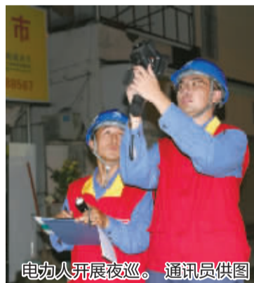
电力人开展夜巡。

时段休息,午后再持续奋战到晚上7时,对电力建设者来说是非常寻常的工作状态。”常年跟随记录下电力人工作的摄影师张晋豪感慨,每逢寒暑是最难捱的,但是他们的付出和坚守,换来万家清凉与企业用电无忧。