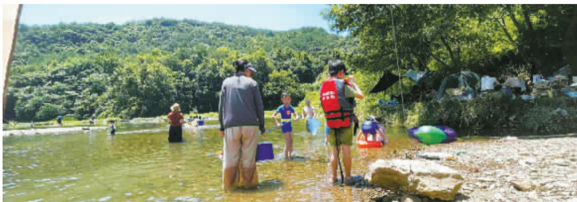
赤日炎炎正当晒。

没有洗发水,就把新鲜摘下的木槿叶放在盛水的盆里使劲揉搓,会有黏稠、润滑的液体渗出,手感有点儿像抹了肥皂。据说,木槿叶含有大量肥皂草素和肥皂草苷,有滋养秀发的作用。 记者 石承承