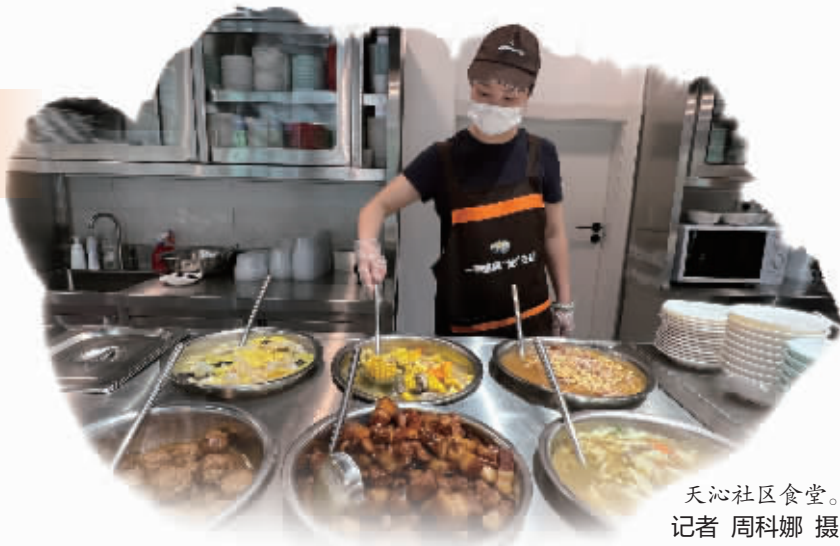
天沁社区食堂。