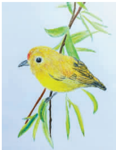
鄞州区第二实验小学西校区501班 胡晨豪(证号2460737)指导老师 胡雷

文竹还是中医药的好帮手,具有润肺止咳的功效。这样说来,文竹不仅文静好看,而且还有医学妙用,可真是一个文雅又有趣的植物。