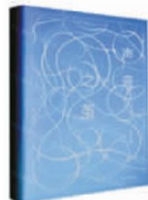
《声音之茧》 作者:苏沧桑 出版社:浙江人民出版社 出版时间:2024年4月

本书由众多图书的读书笔记、随想、感悟构成,每一篇文章介绍一本图书。作者主要记录了自身在阅读中的联想和思考,从而表现出不同书籍的影响和意义。