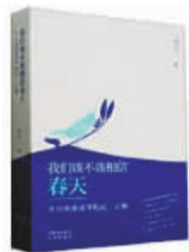
《我们该不该相信春天》 作者:阿艾 出版社:中译出版社 出版时间:2024年4月

本书由众多图书的读书笔记、随想、感悟构成,每一篇文章介绍一本图书。作者主要记录了自身在阅读中的联想和思考,从而表现出不同书籍的影响和意义。