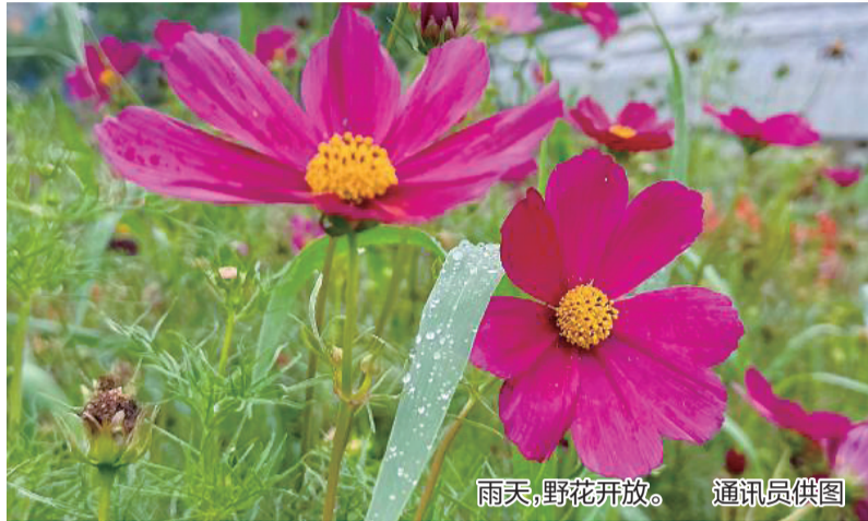
雨天,野花开放。

6月21日,二十四节气中的夏至。相比“吃过夏至面,一天短一线”的昼夜变化,大伙儿眼下更关心的是:淅淅沥沥的梅雨会下多大?要下多久?