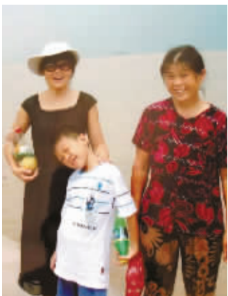
那年,53岁的母亲、6岁的儿子、34岁的我。

记忆中,母亲一生极要强。她两岁时我外婆过世,不久继母进门,除了带来年龄相仿的女儿,几年间又陆续添了三儿一女。家里负担沉重,母亲刚满十八岁便嫁给了父亲。她出嫁前,在娘家后母的严苛管教下,早练就了十八般本领:插秧割稻、采桑养蚕、纺纱织布、缝衣做鞋、打柴挑水、养鸡养猪、种菜做饭,里里外外都是一把好手。我之所以对农村母亲们的各种本领如数家珍,纯粹是幼时天天看到母亲忙碌的身影,耳濡目染记住的。