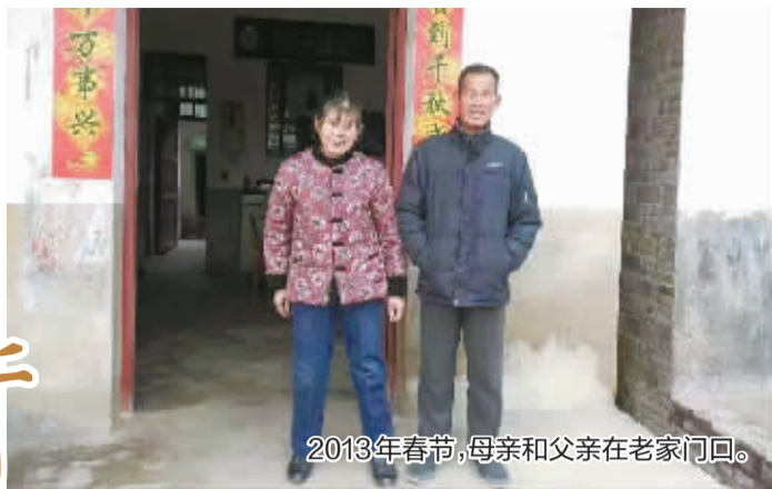
2013年春节,母亲和父亲在老家门口。