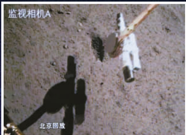
6月4日在北京航天飞行控制中心屏幕上拍摄的嫦娥六号取样回放画面。