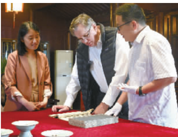
马歇尔在天一阁查阅治胃病的中医古方。

“幽门螺杆菌是人类胃肠健康的大敌。”昨天上午，诺贝尔奖获得者、幽门螺杆菌发现者之一的巴里·马歇尔教授，受宁波市第二医院邀请来到宁波，进行了一场有关幽门螺杆菌防治的讲座。