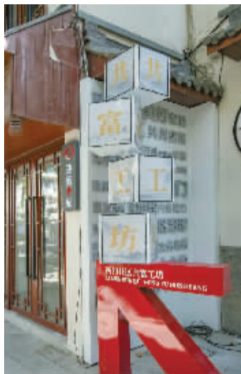
招宝山街道西门社区共富工坊。

环境提升上,将打造“一带两环、一心多点”城市公共绿化系统——“一带”即沿轨道开放空间带,“两环”即老城绿环和城外绿环,“一心”即老城开放核心空间,并同步推进180万平方米老旧小区和各社区口袋公园的改造,促进人居环境品质大提升。