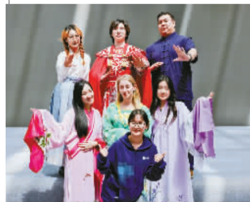
戏曲进高校活动现场。