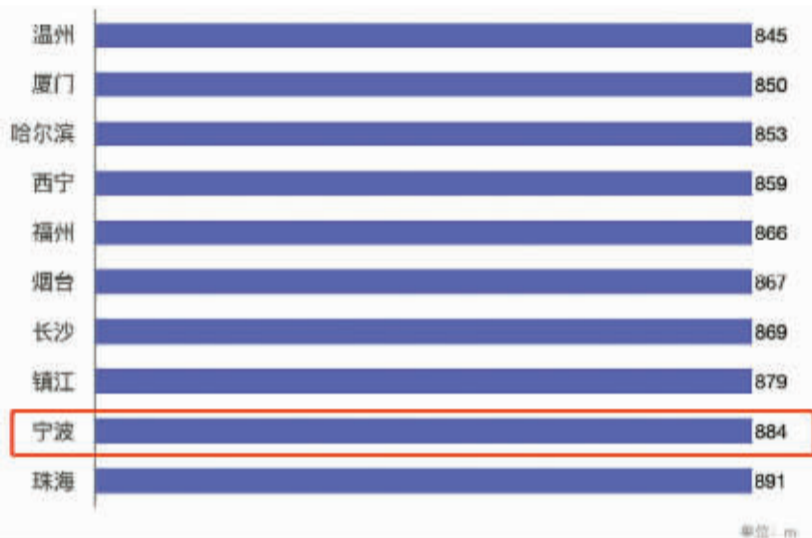
公共交通出行中的平均步行距离短的TOP10城市