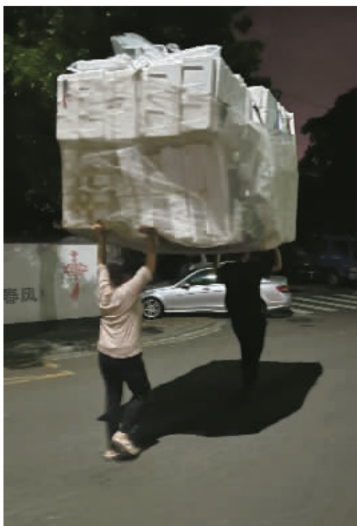
就像他们一起，举起生活的大山。