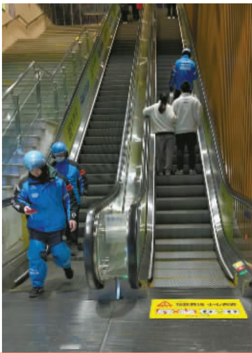
他们匆匆而过，和时间赛跑。