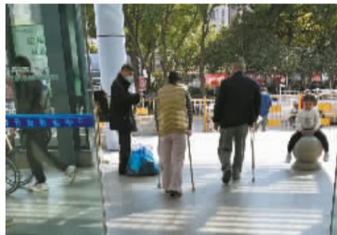
跑得再快的人，有一天也会蹒跚而行。但他们同样不服输、不认命。