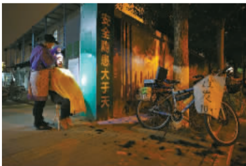
灯影婆娑，他同样那么认真，做好头等大事。