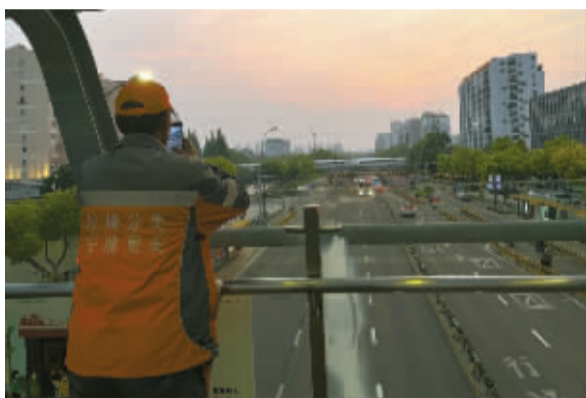
居然有一天，下班比太阳还早。走在路上，看什么都很美好。这个头顶阳光的人，真可爱。

她从数千张照片里，挑出了一组“光里的人”，她和他们萍水相逢，擦肩而过，不同的光打在他们身上，她记住了他们闪光的样子——