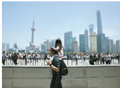
她在看世界，坐在父亲的肩头。