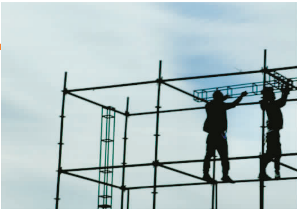
他们一起，奏响城市的乐章。