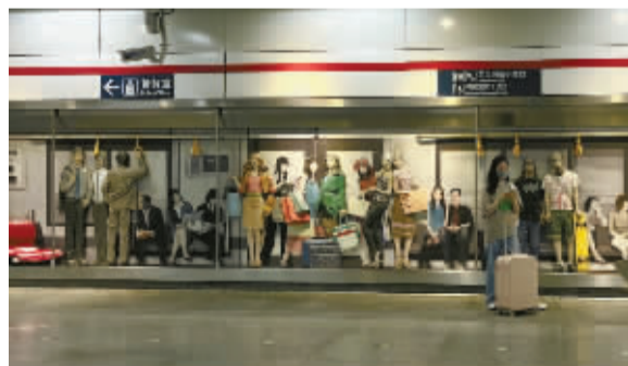
她也在看世界，在一个人的孤独旅程中。

我们也曾是坐在父亲肩头的孩子，后来明白了，生活是一场修行，修行是一个人的事，其他人都是陪练。但有那么多人，与我们以同样的姿态向光而行，这一路就不会孤单。