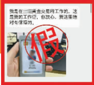
骗子第二步，介绍假身份，然后引出“炒黄金”的事。