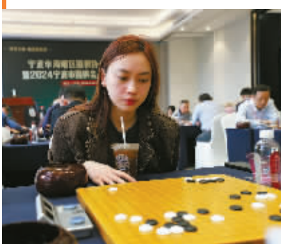
比赛现场。