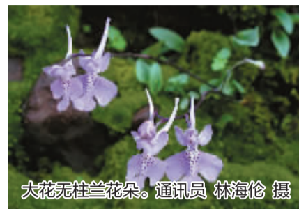
大花无柱兰花朵。通讯员 林海伦 摄