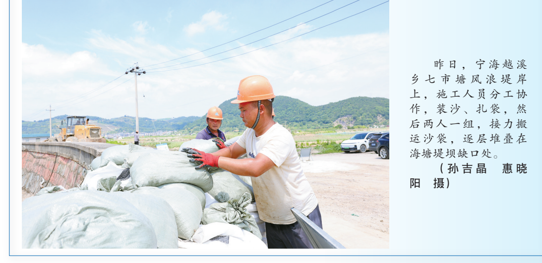
昨日，宁海越溪乡七市塘风浪堤岸上，施工人员分工协作，装沙、扎袋，然后两人一组，接力搬运沙袋，逐层堆砌在海塘堤坝缺口处。