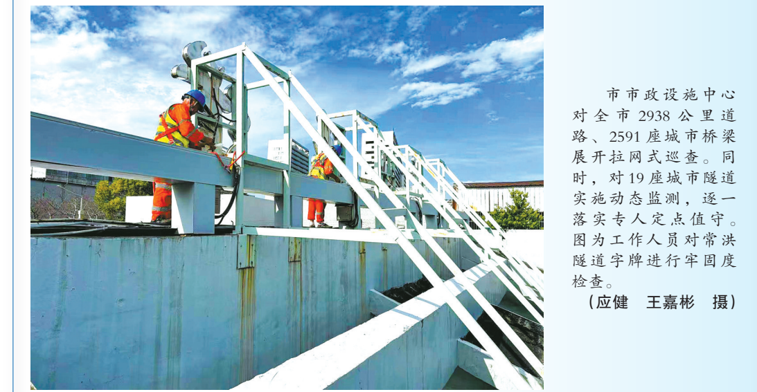
市市政设施中心对全市2938公里道路、2591处城市桥梁展开拉网式巡查。同时，对19处桥梁隧道实施动态监测，逐一落实专人定点值守。因为工作人员对常洪隧道支撑进行牢固度检查。