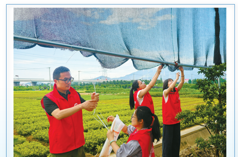
花田里的“护花使者”

截至昨日下午，江北区已累计出动工作人员50余人次，巡查指导农业合作社、家庭农场、种植大户30余家，排查并加固果蔬大棚3000余亩；农户已抢收1500余亩成熟的葡萄、水蜜桃、梨等水果，力争在台风登陆前将损失降到最低。