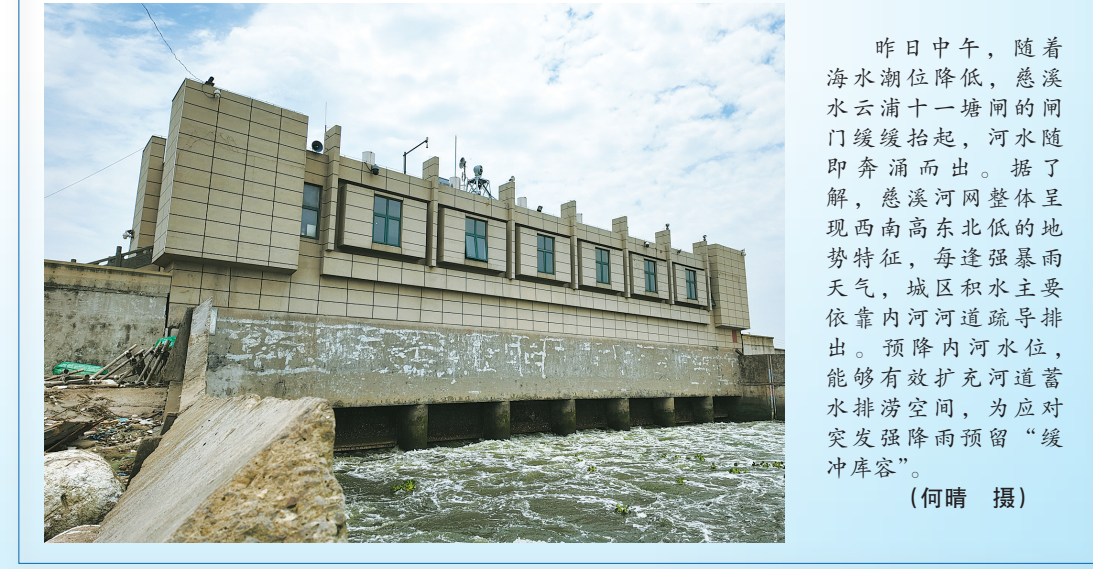
昨日中午，随着海水潮位降低，慈溪水云浦十一塘闸的闸门缓缓抬起，河水随即奔涌而出。据了解，慈溪内河水位呈现西南高东北低的地势特征，每逢强降雨天气，城区积水主要依靠内河河道疏浚排出。预压内河水位，能够有效扩充内河蓄滞空间，为应对突发强降雨预留“缓冲库容”。