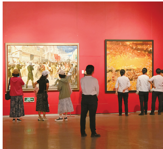
观众在宁波美术馆展厅

三江奔涌不息，丹青永续初心。这场馆藏红色美术大展以百余幅跨越时空的原作，串联起105载风雨征程。站在现代化滨海大都市建设新起点，本次展览既是献给党的诚挚文艺礼赞，更是激励全市群众传承红色基因、勇立发展潮头的精神火炬。展览持续至7月15日，广大市民可在笔墨丹青间回望峥嵘岁月、汲取奋进力量。