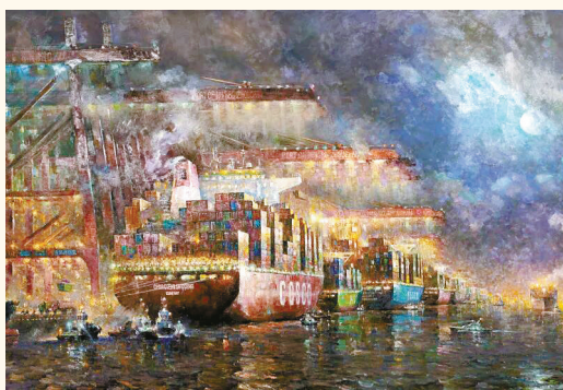
《大港雄姿》 陈继武、张曦 油画 2025