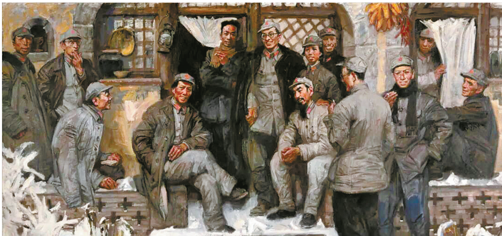
《瓦窑堡会议》 沈尧伊 油画 2014