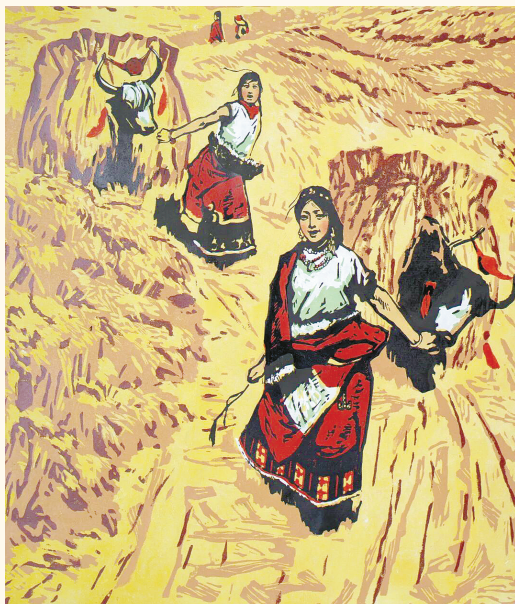
《初踏黄金路》 李焕民 版画 1963