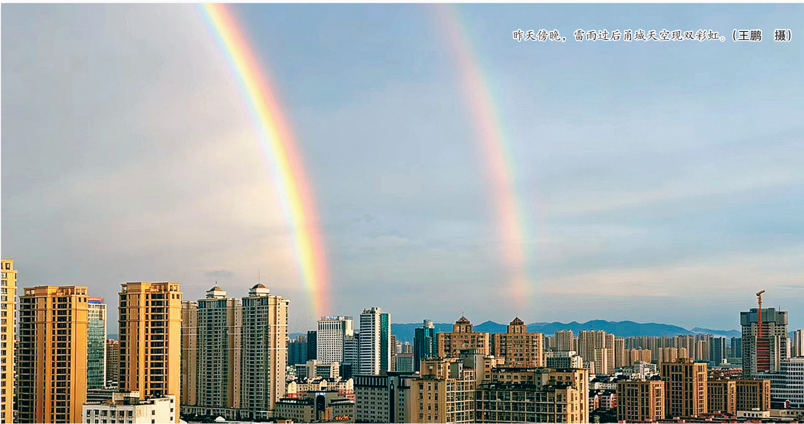
昨天傍晚，雷雨过后甬城天空现双彩虹。