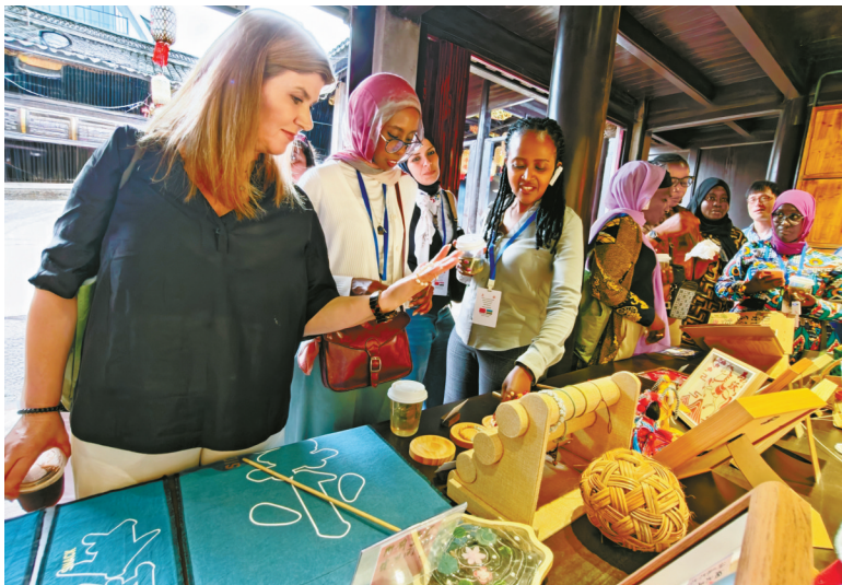
外国友人对手艺人部落展示的手工艺品兴趣盎然。

阳光斜斜穿过雕花窗棂,在青砖黛瓦间投下斑驳光影。位于镇海庄市街道永旺村的阮氏宗祠里,又传出了阵阵惊叹声。