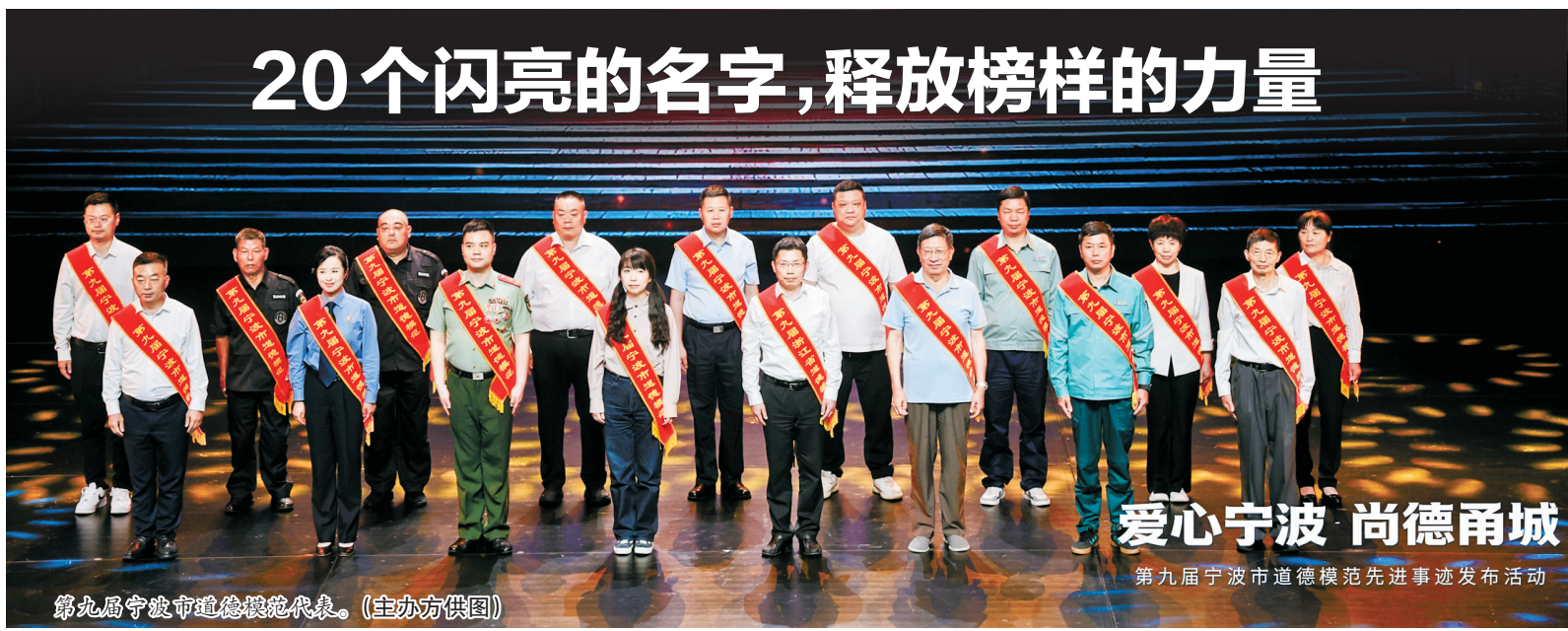
第九屆宁波市道德模范代表。

沈铭权在鄞州开展民生领域信访问题集中治理及重点企业调研。他强调，要深入学习贯彻习近平总书记重要讲话指示精神，按照市委工作要求，牢固树立和践行正确政绩观，统筹好发展与民生，抓实企业创新发展、民生信访治理等重点工作，以产业提质升级激活发展动能，以民生精细服务增进百姓福祉，在率先呈现基本实现社会主义现代化生动图景上示范先行。