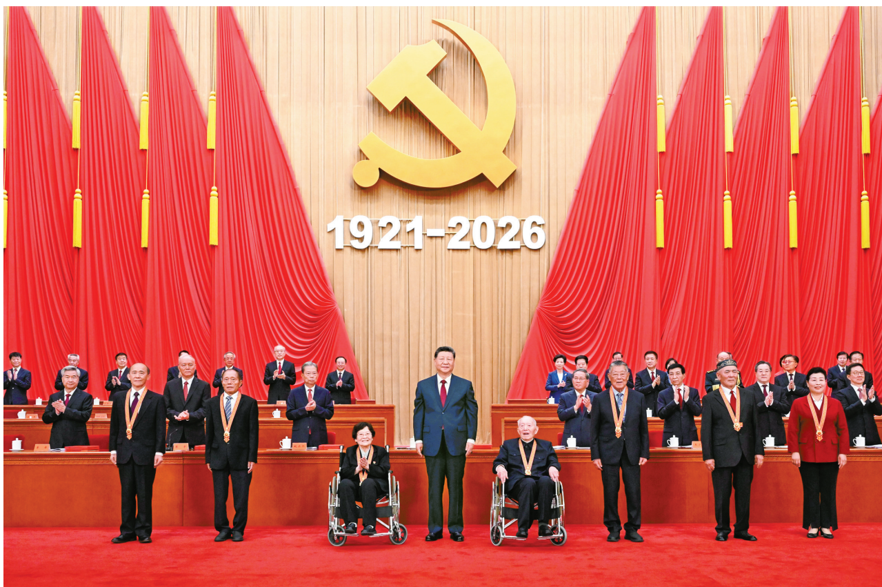
7月1日上午,庆祝中国共产党成立105周年大会在北京人民大会堂隆重举行。中共中央总书记、国家主席、中央军委主席习近平向“七一勋章”获得者颁授勋章。