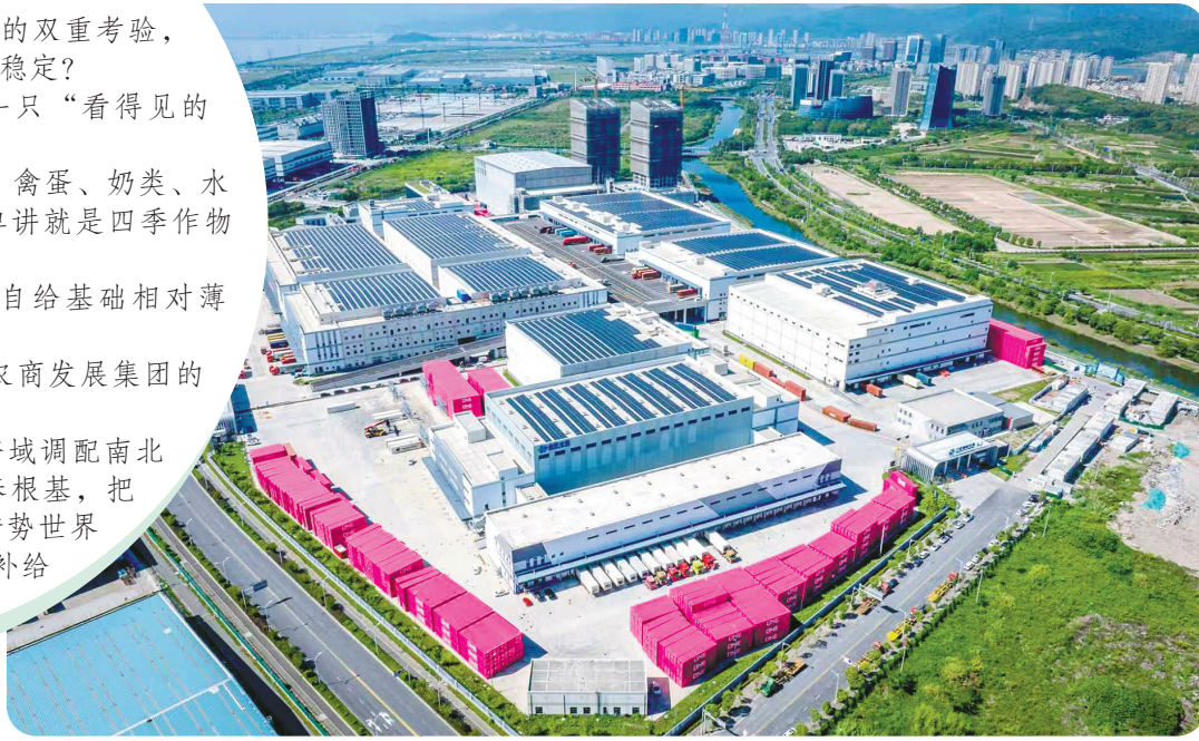
梅山冷链项目一期、二期全景图

向内畅通全国货源集散通道，跨域调配南北各地优质农货；向下扎根本土种养根基，把时令鲜蔬稳在田间地头；向外借势世界级港口，搭建国际冷链生鲜补给门户。