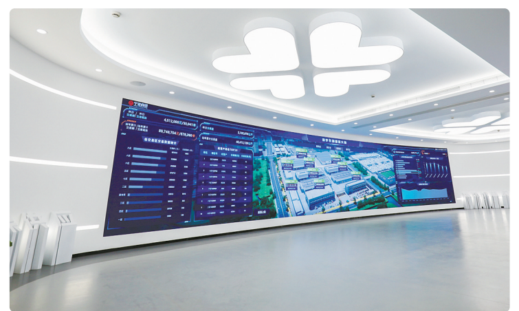
“数智菜篮子”线上平台

“在市国资委指导下，我们以开展树立和践行正确政绩观学习教育为契机，继续抓实抓细‘菜篮子’保供，统筹生产、流通、进口全链条资源，以更完善的体系、更务实的举措守护群众餐桌。”宁波农商发展集团相关负责人说。