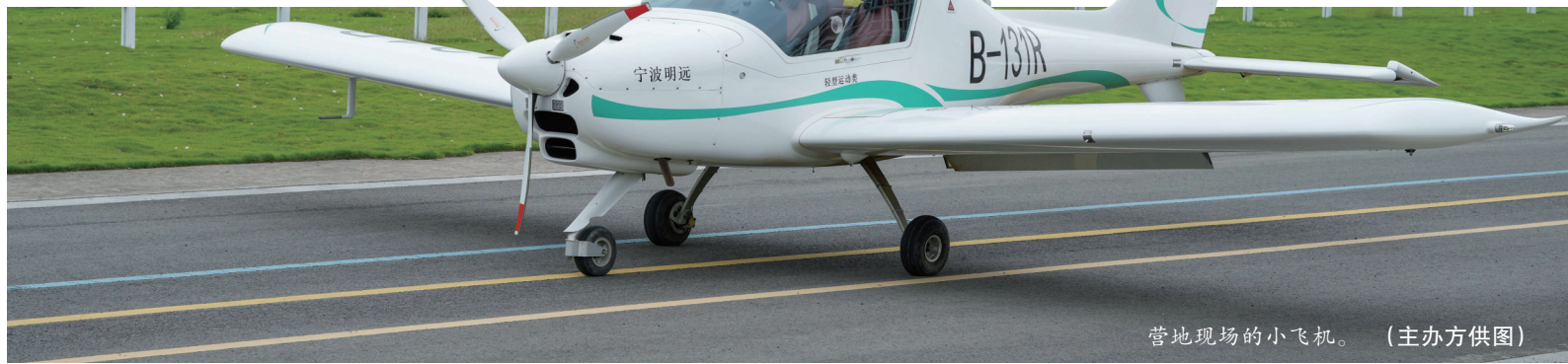
营地现场的小飞机。

光有热闹还不够，得有硬核支撑。这个月，营地刚完成新一轮升级——无人机竞速场地对标国际赛标准，全域导览系统焕然一新。花火晚会、跨年音乐会、低空观光、飞行考证、亲子研学……产品不断迭代。