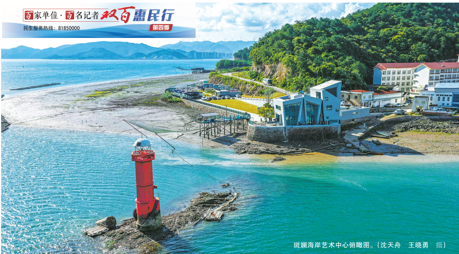
斑斓海岸艺术中心俯瞰图。