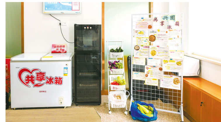
社区里的共享冰箱。