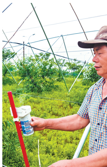
桃农正在调试“驱虫神器”。