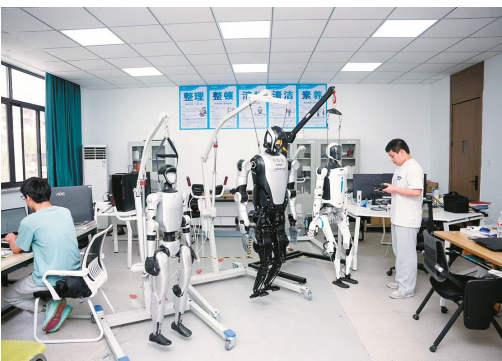
人形机器人项目化教学现场