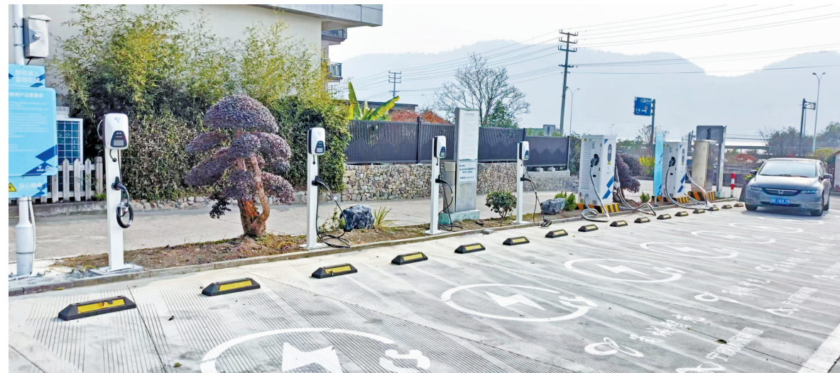
象山茅洋乡花墙村充电桩。

近年来，宁波推进打造“市域智能充电一张网”，充电网络不断向县域延伸。象山茅洋乡花墙村是乡村旅游重点村，去年4月，花墙村主动要求尽快加入宁波环保集团充电基础设施投建“村村通”计划，不久后，快充和慢充设备各4台在该村