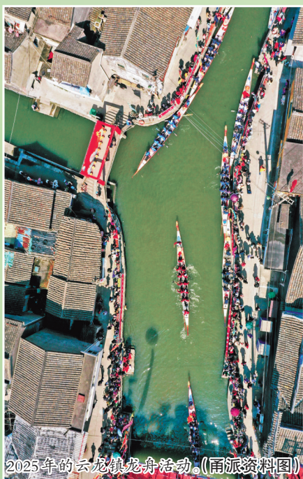
2025年的云龙镇龙舟活动。(甬旅资料图)