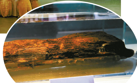
施吞遗址出土的杨梅枝干。

枝干。后经研究鉴定，这两段枝干为距今4500多年的良渚文化时期杨梅树遗存，是目前国内年代最久远、证据最确切的杨梅树遗存，为余姚杨梅的千年文脉传承提供了权威的考古实证。