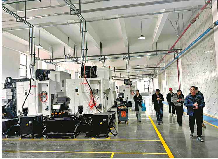
企业服务经理人走进企业。（资料图）