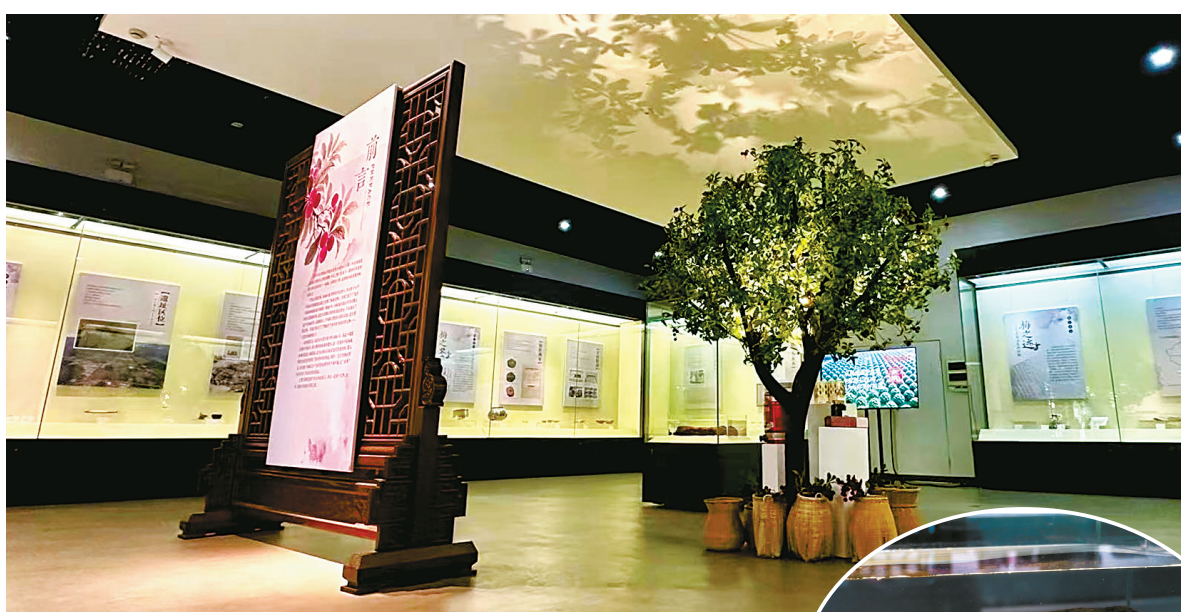
“寻梅记：4500年前的余姚味道”临时展览。

余姚杨梅种植历史悠久，早已成为当地标志性的地域文化符号。上世纪80年代中期，浙江省博物馆通过对河姆渡新石器时