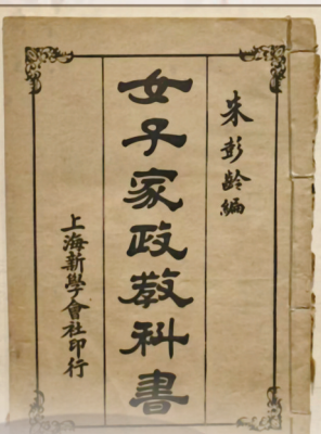
陈列在宁波教育博物馆内的《女子家政教科书》封面

上海新学会社突破书籍买卖经营模式，邀请留学者特别是留日学生翻译日本新教材和新学著作，介绍国外新发明、新成就，传播新知新学。短短几年间，新学会社踩准时代节奏，取得长足发展，相继在北京琉璃厂、汉口黄皮街、广州双门底和济南、天津等地开设分社，迅速发展为一家集编辑、出版和发行网络于一体的进步文化机构，鲁迅也曾有著作由新学会社代分为销。